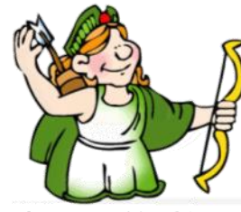
Imagem 10 - Diana

12.1. Refere as funções dos deuses apresentados nas imagens acima.