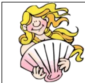
Imagem 8 - Vénus