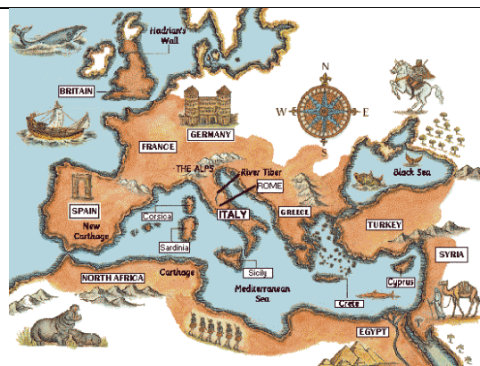
Imagem 1 - Império Romano

4.1. Explica por que razão os Romanos chamavam "mare nostrum" ao Mar Mediterrâneo.