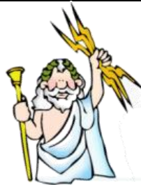
Imagem 9 - Júpiter